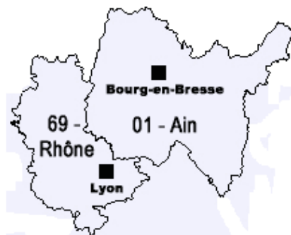
Carte géographique du secteur d'intervention

Département (s) d'intervention couvert(s) :