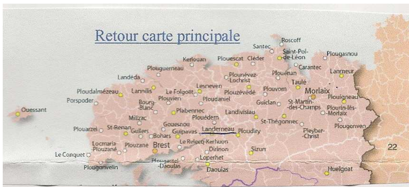
Carte géographique du secteur d'intervention

Département (s) d'intervention couvert(s) :