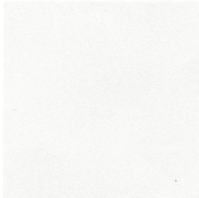
Carte géographique du secteur d'intervention