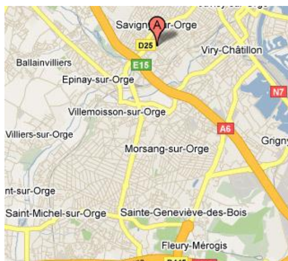
Carte géographique du secteur d'intervention

Département (s) d'intervention couvert(s) :